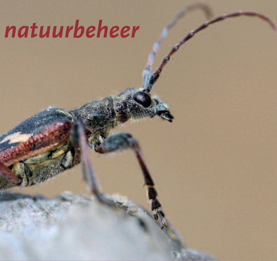
Rhagium bifasciatum (boven) en Pentatoma rufipes (onder).

Voorts behandelen enkele artikelen in dit themanummer effecten van begrazing op insecten. Het belang van grote kadavers (zowel van wild als van grazers) voor insecten sluit hier bij aan. Actiever natuurbeheer voor ongewervelden wordt onder de loep genomen in bijdragen over heideakkers en het introduceren van kleine fauna met maaisel. Hoe een insectenrijk ecosysteem doorwerkt in de voedselketen – en dus ook naar een groep als vogels – vormt de afsluiter van het themanummer.