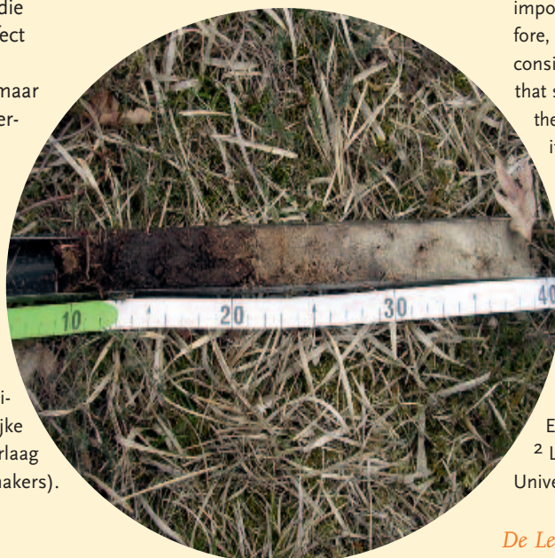
Foto 3. Bodemonster van heischraal grasland met organisch rijke bovenlaag en minerale onderlaag.

Het bodemleven beïnvloedt de groei van individuele plantensoorten binnen de gemeenschap; het heeft een sturende rol in de successie. Daarom is het belangrijk om voorzichtig te zijn met het afgraven van de toplaag van natuurontwikkelingsgebieden. Immers, met de voedingsstoffen worden eveneens de meeste zaden en bodemorganismen afgevoerd. Inbrengen van bodemorganismen kan de ontwikkeling van latere successie plantensoorten stimuleren en de successie versnellen. Het is dan wel belangrijk dat de omstandigheden voor het bodemleven gunstig zijn. Andere mogelijkheden om natuurontwikkeling te versnellen zijn bijvoorbeeld het inzaaien van planten, die bodemorganismen met een gunstig effect op laat-succesie planten stimuleren. Inzaaien heeft natuurlijk ook nadelen, maar de voordelen ervan zouden verder onderzocht kunnen worden. In ieder geval geven de resultaten van recent onderzoek aan dat een goede conditie van het bodemleven belangrijk is voor het beheer van de vegetatie. Het is goed als beheerders wat vaker hun hoofd 'onder het maaiveld' steken.