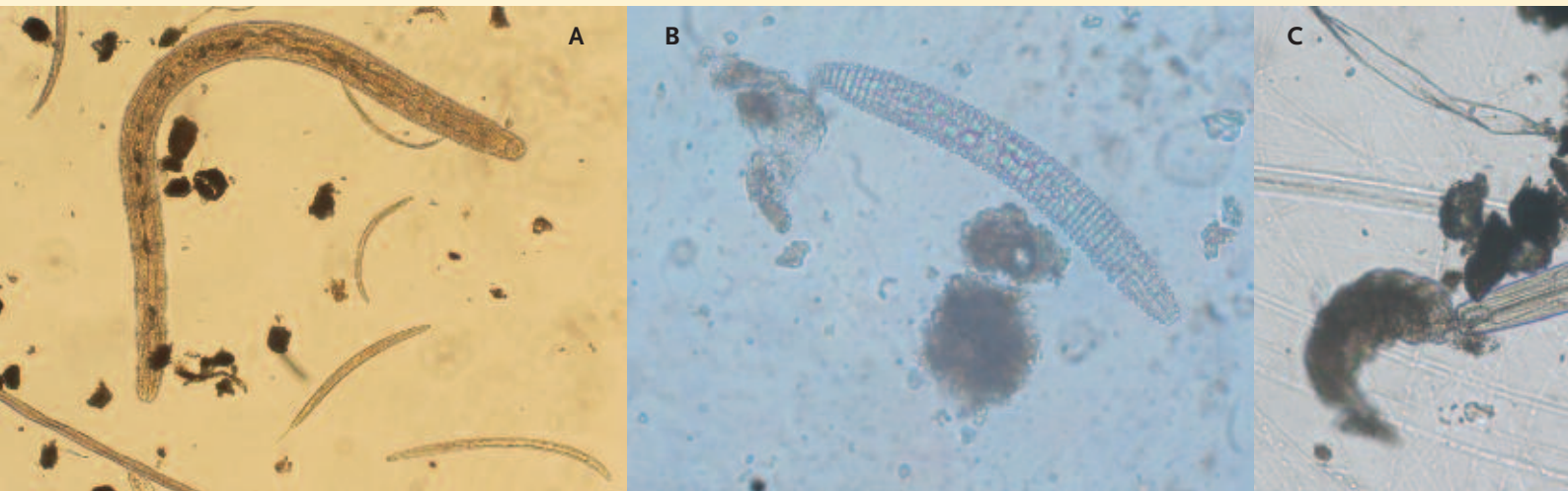
Foto 1. A) Potworm (100x; ca. 3 mm); B) herbivore nematode (400x; ca. 0,3 mm); C) predatore nematode (rechts; ca. 2 mm) heeft beerdier-tje (links; ca. 0,2 mm) gevangen (400x); D) bacterivore nematode (400x; ca. 0,6 mm); E) raderdier-tje (400x, ca. 0,1 mm).

Bacteriën en schimmels zorgen voor de afbraak van organisch materiaal. In landbouwsystemen hebben bacteriën de belang-