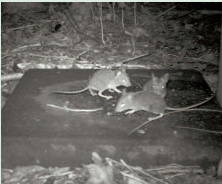
Foto 1. Een bijzondere foto uit het experiment; slechts een enkele keer lieten meerdere muizen zich tegelijk zien.