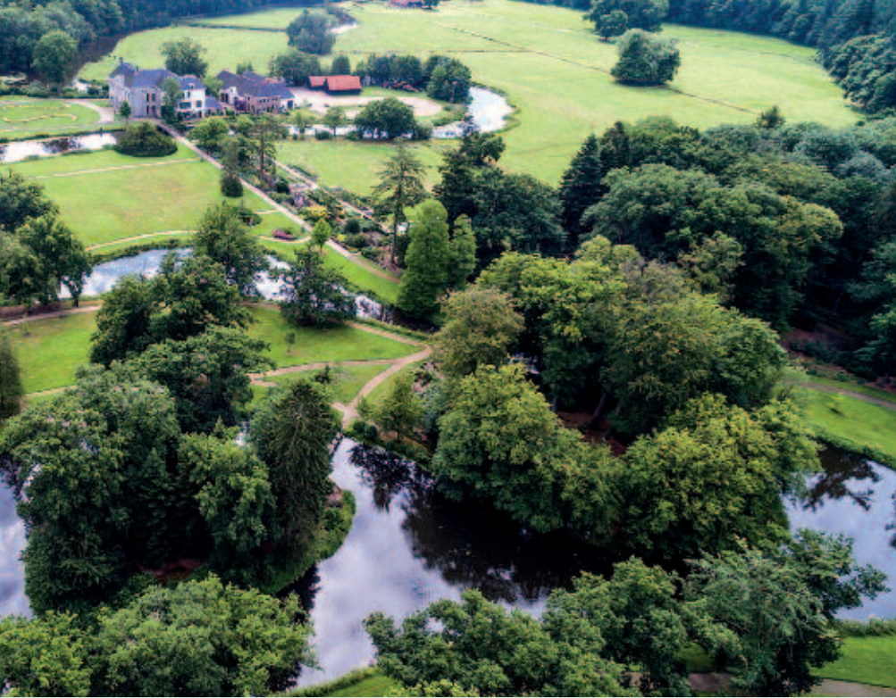
Foto 1. Waterlandgoed Singraven. Gedeelte met de gestuwde Dinkel waarin centraal gelegen Huis Singraven. Op de voorgrond park de Hertenbaan waarvan de parkgracht dienst doet als vispassage. De bossen aan de horizon zijn De Mors (links) en Voelebroek (rechts) (foto: Waterschap Vechtstromen).

gen, waardoor de Dinkel stroomopwaarts van de molenstuw een infiltrerende rivier en benedenstrooms drainerend is geworden. Uit de historische beschrijvingen blijkt hoe groot de invloed van de gestuwde Dinkel is geweest. Rond 1450 heeft de bisschop van Utrecht kunnen instemmen met het hoge stuwpeil van de Dinkel onder voorwaarde dat er een omvloed (Bijndinkel; fig. 1) zou worden aangelegd dat met de molenrechten is bezegeld. In 1532 wordt voor de eerste keer melding gemaakt door de rechthebbende van de molenrechten (kader 1). Ook werd in 1696 een reactie opgetekend door de boeren en ingezetenen van de marke Beuningen die gronden hadden liggen in het Voelebroek en De Mors, in de stuwschaduw van de watermolen (kader 1). Een conclusie zou kunnen zijn dat in iets meer dan honderd jaar tijd de Dinkel door opslibbing een zodanige hoogte heeft gekregen dat omliggende gronden zo nat zijn geworden dat een