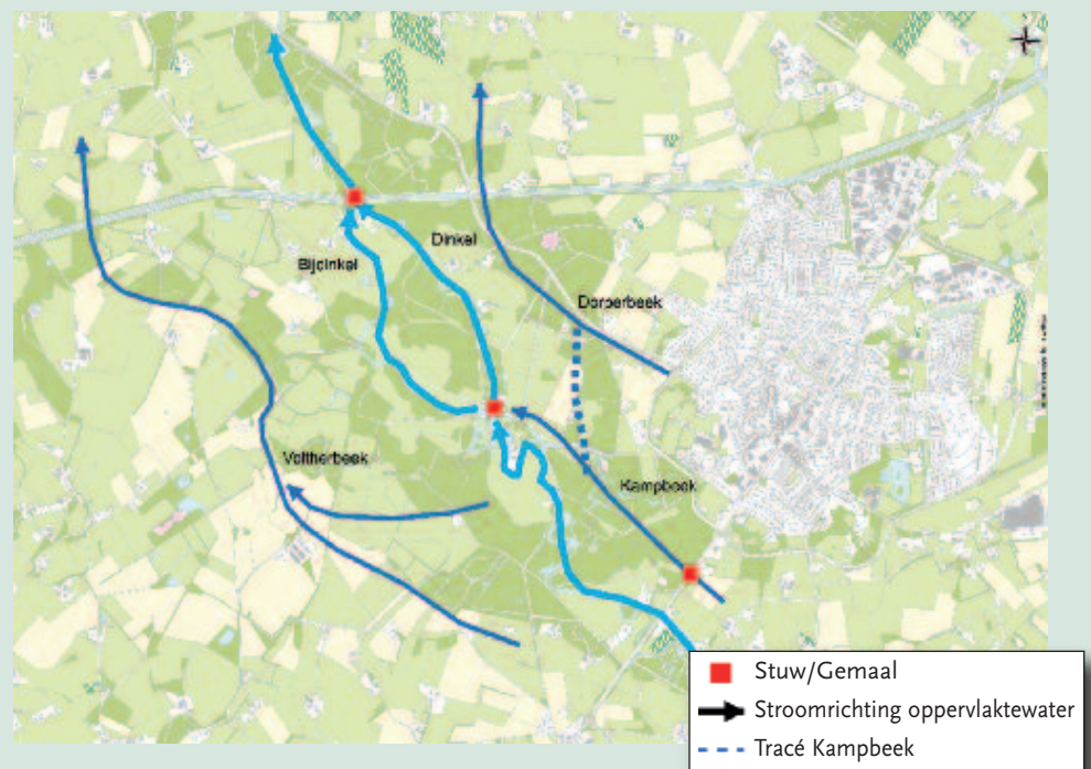
Fig. 1. Globale ligging van de grotere afwateringssystemen op Landgoed Singraven.

Het grondwatersysteem heeft evenals het oppervlaktewatersysteem een prominente invloed op Singraven. Het gaat om invloed van regionale én lokale grondwaterstromen. De goed water doorlatende lagen bestaan uit zand en de slecht doorlatende lagen bestaan uit leem en klei. Door een trechtervormige vernauwing in de slecht doorlatende ondergrond wordt het diepe grondwater als kwelwater naar het oppervlak gestuwd. Vanwege het kleinschalige reliëf zijn aan het oppervlak diverse lokale grondwatersystemen aanwezig. Invloed van lokale systemen doet zich vooral gelden op overgangen van lokale dekzandruggen naar aangrenzende laagtes. Daarnaast zorgt de gestuwde Dinkel bovenstrooms van de watermolen nog eens voor kwel vanuit de