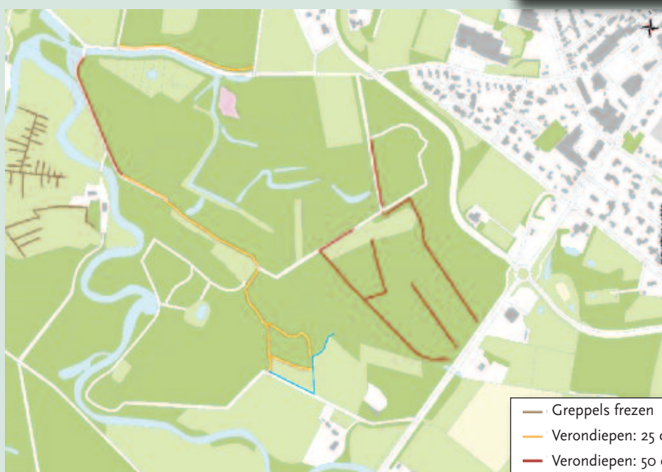
Fig. 2 Toponiemen op het landgoed Singraven (© 2016, Dienst voor het kadaster en openbare registers, Apeldoorn).