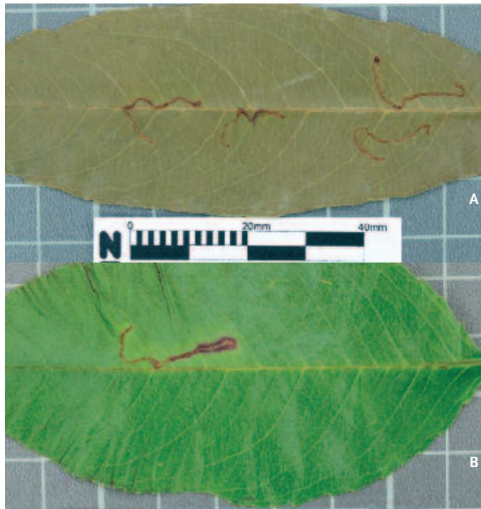
Foto 1. Mijnen van de Hangmatmot ( Lyonetia clerkella ) op blad van Amerikaanse vogelkers. A. Herbariumcollectie uit augustus 2002 verzameld door Ben van As in Monster. B. Herbariumcollectie uit augustus 2016 verzameld door Barbara Gravendeel in Meijendel bij Wassenaar.

Het merendeel van de herbivoren van Amerikaanse vogelkers heeft een korte generatietijd en is zeer mobiel (Schilthuizen et al., 2016). Op termijn kan dit ervoor zorgen dat lokale herbivoren de plantensoort onder de duim krijgen, waardoor het invasieve karakter verdwijnt. Handmatig verwijderen van deze exoot uit de Nederlandse duinen zal dit proces echter vertragen. We pleiten er dan ook voor om invasiviteit van Amerikaanse vogelkers niet langer als een statische eigenschap te beschouwen en beheermaatregelen hierop aan te passen, zoals van der Putten & Rienks (2004) ook al suggereerden.