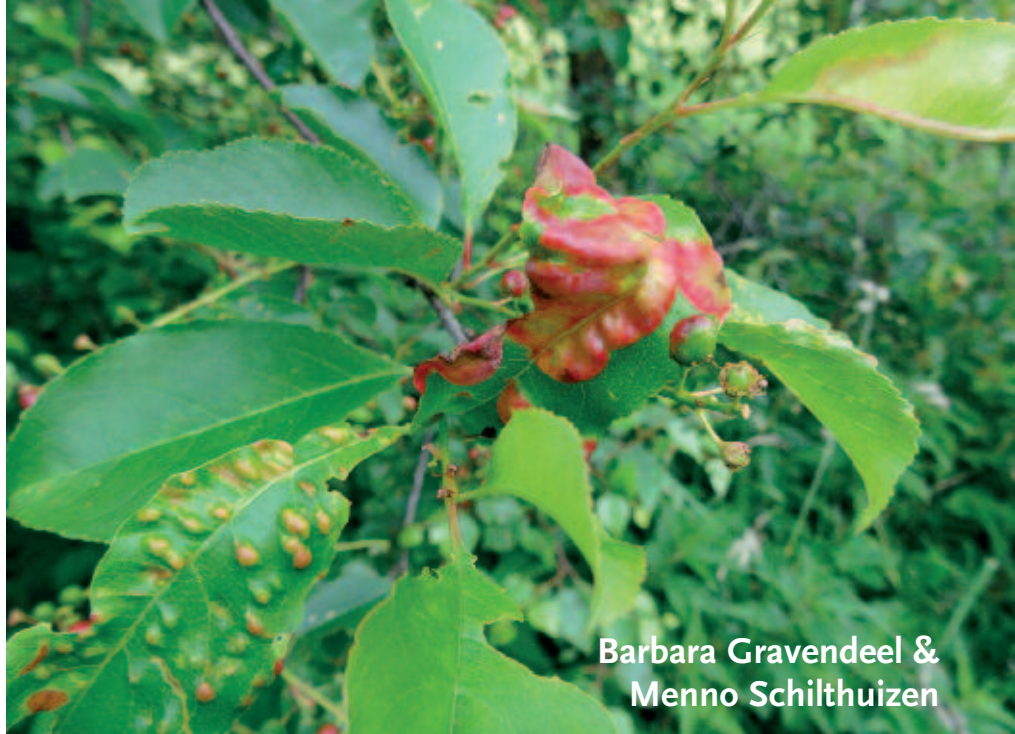
Barbara Gravendeel & Menno Schilthuizen

Door het aantal aangevreten bladeren te delen door het totaal aantal bladeren van collecties van beide soorten vogelkers uit het herbarium van Naturalis Biodiversity Center hebben we het percentage vraat tussen 1844 en 2015 bepaald. Veranderingen door de tijd zijn geanalyseerd met een Pearson test voor lineaire correlaties. Voor Amerikaanse vogelkers hadden we 96 collecties ter beschikking en voor Gewone vogelkers ( Prunus padus ) 222. Het percentage vraat aan de exoot is significant verdubbeld van 18,8 naar 40,6%, terwijl dat bij de inheemse verwant constant rond de 35% bleef (fig. 1). Vooruitlopend op de algemene misvatting dat botanici enkel 'ongeschonden' herbariumcollecties zouden aanleggen, hebben we Eddy Weeda gevraagd om in navolging van zijn in 1975 gemaakte collecties in 2015 opnieuw vogel-