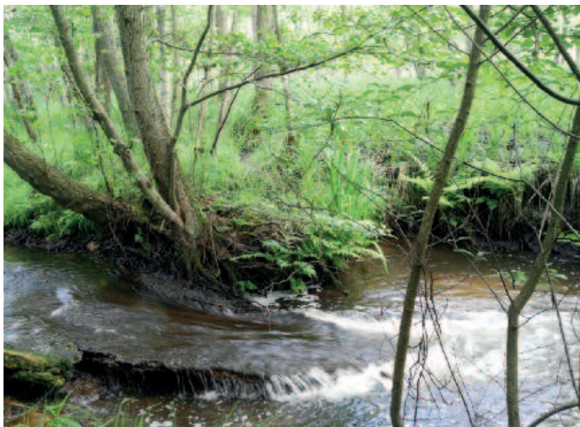
Foto 3. Actieve insnijding van de Roosterbeek. Door inklinking van het veen staat Zwarte els op stelten.

schietveld van Houthalen-Helchteren. De daar aanwezige diepe sloten worden thans gedempt. Ook grondwaterwinningen en mijnverzakkingen beïnvloeden de watervoerendheid van de beken negatief. Hierdoor is het onmogelijk om bovenstrooms gelegen vijvers, die vroeger belangrijke groeiplaatsen voor Waterlobelia waren, (als vanouds) te voeden met beekwater. Het regenwater uit het nieuwe stedelijke gebied wordt via het riool afgevoerd naar de rioolwaterzuiveringsinstallatie aan de Roosterbeek, net stroomopwaarts van het natuurdomein. Het gevolg is een extra, onnatuurlijk grote toevoer van water naar de Roosterbeek, wat zorgt voor erosie, zeker wanneer bij hevige neerslag piektoevoeren optreden en de overstorten in werking treden. Hierdoor heeft de Roosterbeek zich diep ingesneden en ligt de beek nu 1,5 tot 2 m lager dan de omliggende