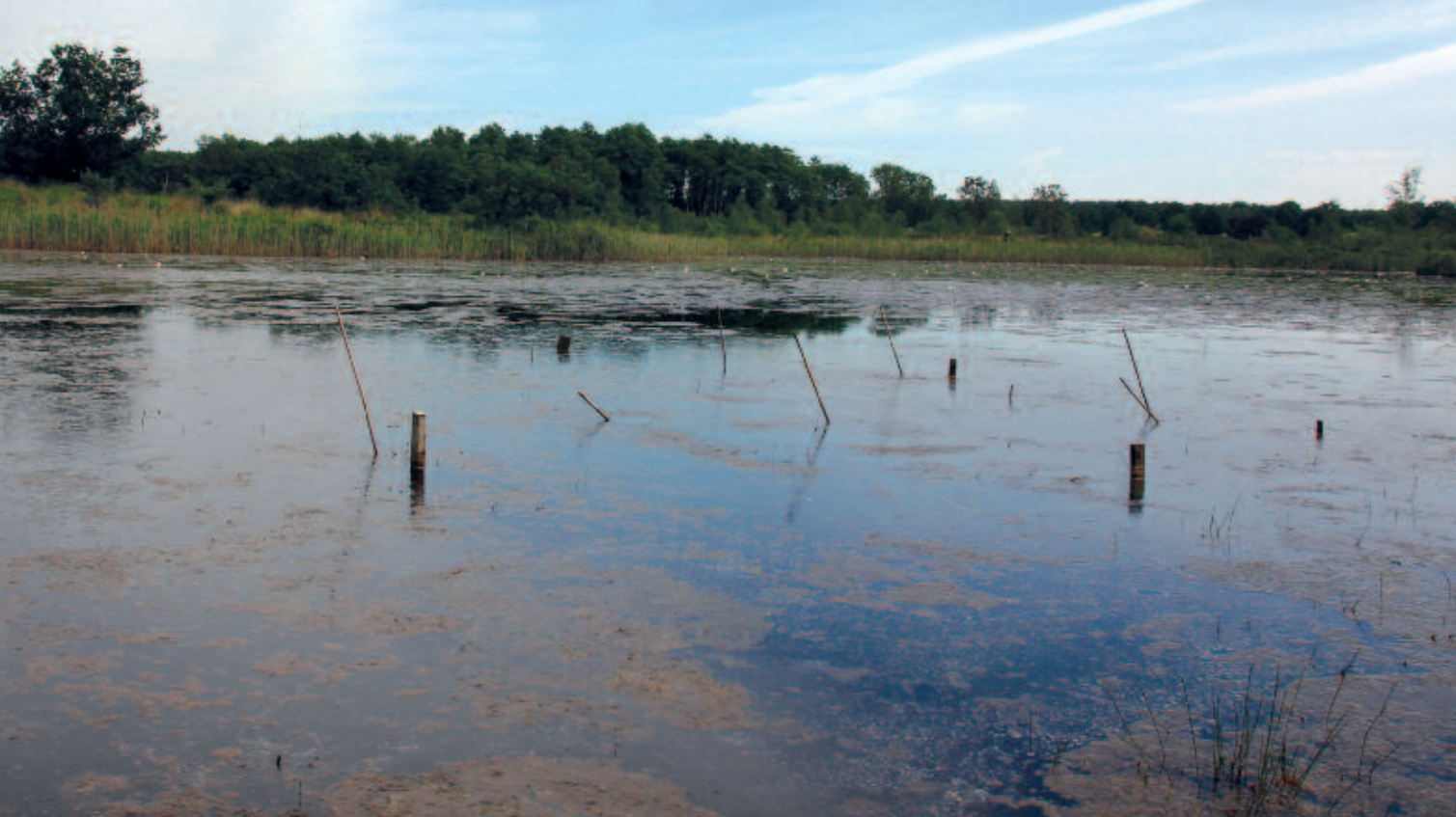
Foto 2. Laatste groeiplaats van Waterlobelia in de Teut: behoud van de soort is alleen mogelijk door periodiek verwijderen van de sliblaag (foto: J. Wellekens).