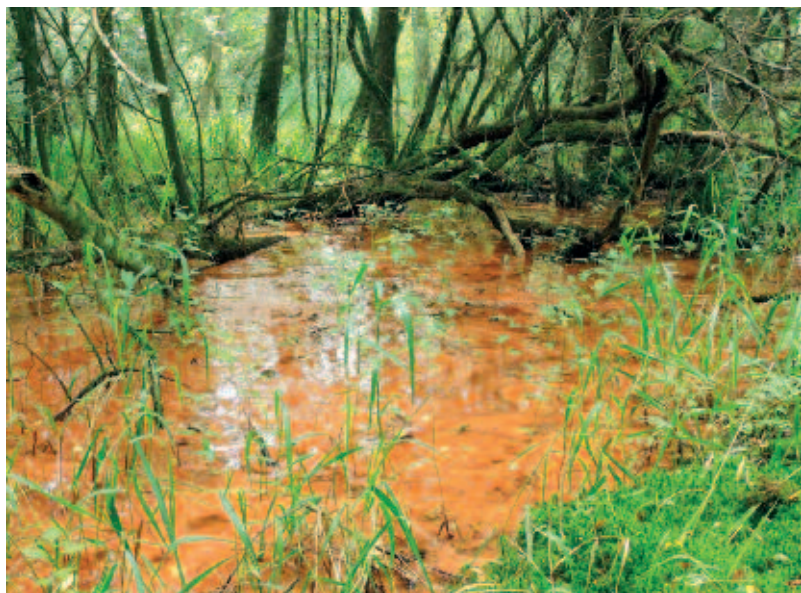
Foto 4. Messcherpe overgang tussen hoogproductief ijzerrijk elzenbroek en mesotroof, ijzerarm venig berkenbroek.

met dichte naaldhoutaanplanten (meer verdamping) en de teloorgang van het lokale slotensysteem (geen oppervlakkige afvoer van regenwater). Dit vermoeden werd deels bijgesteld door de systeemanalyse.