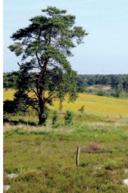
Foto 5. Overgang van droge heidevegetatie naar voormalige graszaadwinning (foto: J. Wellekens).

Deze ontwikkelen zich veel trager naar een gesloten Struikheivegetatie en zijn veel soortenrijker. In de sterk zure droge heide wordt de E-horizont aan het oppervlak gebracht: hier kiemt voornamelijk Struikheide die zich vrij snel sluit. Ook de invasieve mossoort Grijs kronkelsteeltje ( Campylopus introflexus ) blijkt veel invasiever op uitgeloopte podzolbodems dan op de minder uitgeloopte stuifzandbodems. Na enige jaren is de bodem volledig bedekt door Grijs kronkelsteeltje, waarna Struikheide gaat domineren. De voorheen droge, warme zandige condities zijn dan verdwenen, waardoor de droogte- en warmteminnende fauna hier verdwijnt.