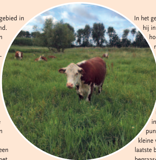
Hereford koeien

Passend bij laag-dynamische deltanatuur wordt een derde van het gebied sinds mei 2016 begraaasd met Herefords: een zelfredzaam koeienras, in een gemengde kudde en een deel heeft er jaarrond gelopen. Het begraaasde deel bestaat uit gras (60%), bos (25%) en water (15%). Het grasland werd voorheen meerdere malen per jaar gemaaid. Nu, ruim een jaar later, zijn de positieve resultaten van deze verandering in beheer al duidelijk te zien.