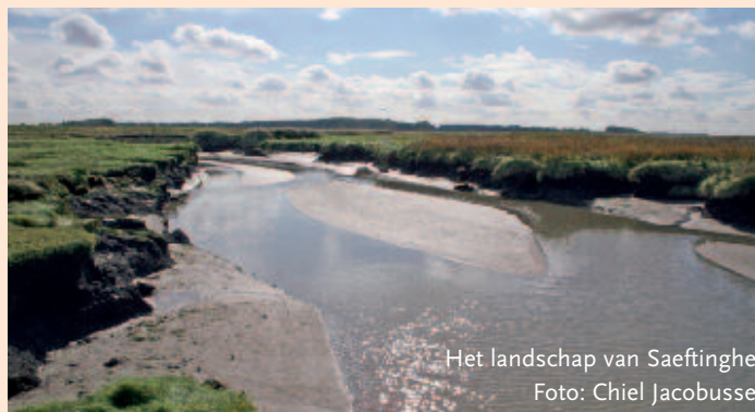
Het landschap van Saeftinghe

Het Verdrongen Land van Saeftinghe is gelegen in het brakke deel van de Westerschelde. Saeftinghe is met een oppervlakte van 2250 ha begroeid schor het grootste brakwaterschor van Europa. Het is een zeer dynamisch gebied waar het getijde een belangrijke rol speelt. Gedurende het hele jaar zijn de schorren en slikken van Saeftinghe belangrijk voor vogels. Uit maandelijkse tellingen blijkt dat tienduizenden trekvogels gebruik maken van Saeftinghe. Het is echter ook een broedgebied voor veel vogels. Aannemelijk is dat voedsel, maar ook de uitgestrektheid en ontoegankelijkheid van het gebied een belangrijke bijdrage leveren aan de aanwezigheid van vogels. Het beheer is onder andere afgestemd op het behoud van een gunstig broedbiotoop. Om te bepalen wat de ontwikkelingen in de broedvogelpopulaties zijn, is naast de jaarlijkse proefvlakken een periodieke integrale inventarisatie van belang. De meest recente is in 2012 uitgevoerd. Het veldwerk is gedaan met vele vrijwilligers, goed voor ruim 1200 manuren. Nu de uitwerking grotendeels klaar is, zijn de eerste conclusies te trekken. Om te beginnen de waarden van Saeftinghe: 536 nesten Visdief, 1.492 territoria Tureluur, 460 territoria Gele kwikstaart, 293 territoria Blauwborst, 231 territoria Waterral en 200 paar Baardman. Een mix van kust-